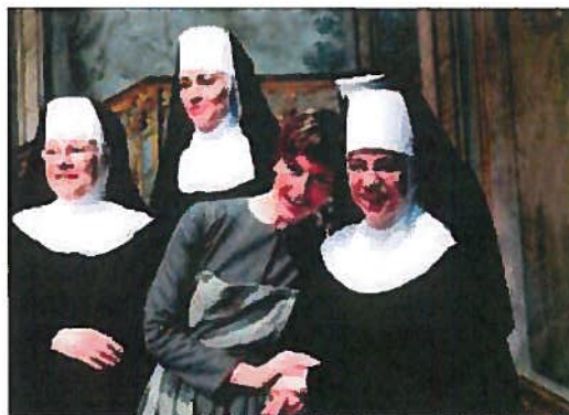
Arriba, el elenco. Abajo, la protagonista junto a las monjas.